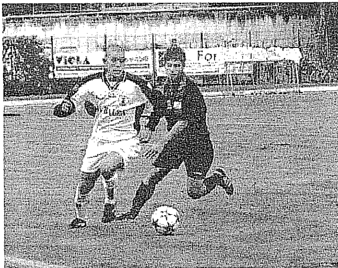
Un'azione della Castellana