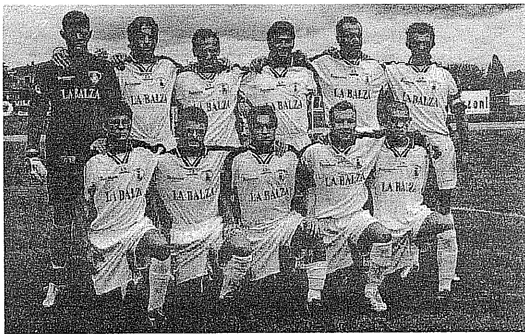
La formazione biancazzurra schierata