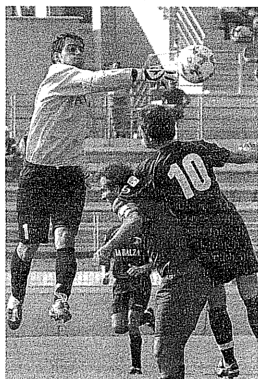
Parente non arriva a colpire il pallone

SALO' (BS) - Che fosse una trasferta difficile lo si sapeva, ma che per la seconda domenica consecutiva dovessimo commentare una netta sconfitta nessuno se lo aspettava. Un Salò ben attrezzato soprattutto in fase offensiva, cinico ed esperto regola per tre a uno una Castellana che si è mostrata troppo lenta nella manovra e fragile nei momenti clou del match.