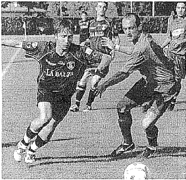
Un biancazzurro impegnato in un contrasto