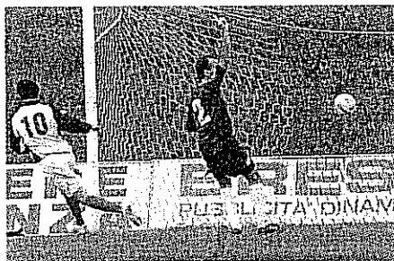
Piro firma il gol del 2-0