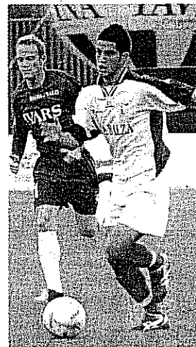
Cancian palla al piede