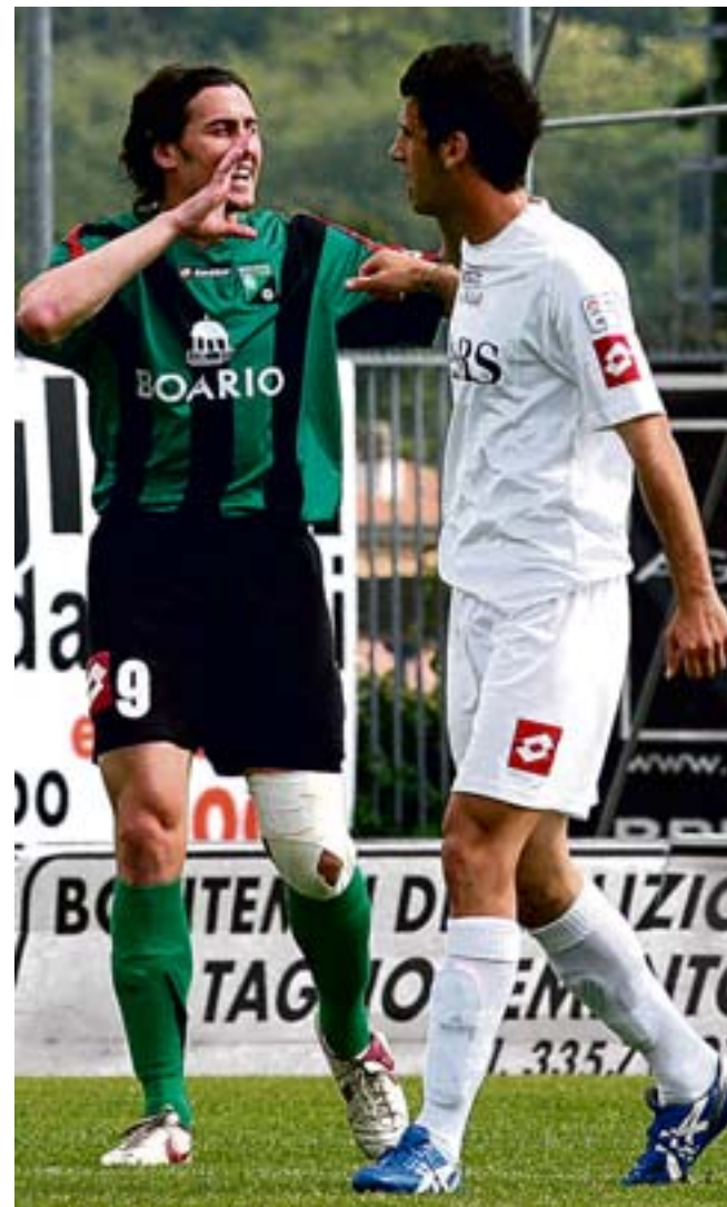
Rossetti e Savoia: comincia il lungo faccia a faccia tra Darfo e Salò

Formazione con il ritorno di Guizzetti in porta che ricarl-