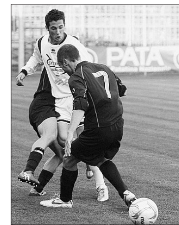
Lewandowski in azione