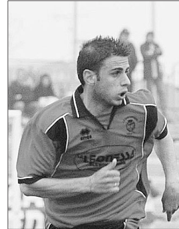
Fornoni potrebbe esordire oggi

Dopo l'impresa di sette giorni fa con la lanciata Tritium (pareggio 3-3), il Darfo proverà oggi ad ingranare la marcia della vittoria sul campo del Renate, in provincia di Milano, contro una squadra reduce dal pareggio con il Como.