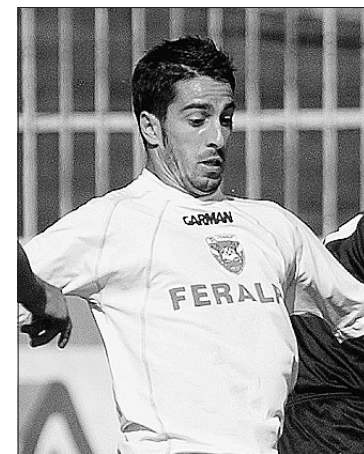
Pulina della Feralpi Lonato