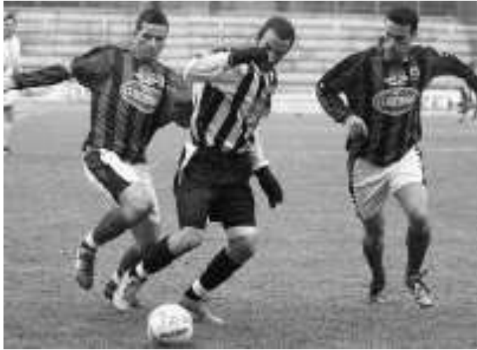
Contro il Salò i rossoneri sono apparsi deconcentrati e mai pericolosi