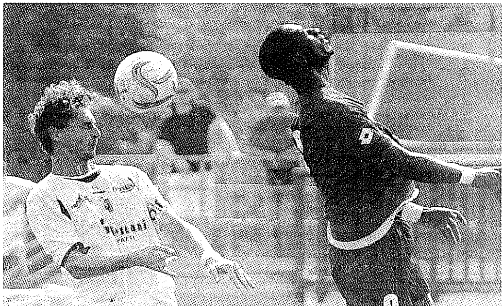
Capitan Bastia anticipa di testa Ndzinga

Al di là di quanto successo ieri, va menzionato un fatto: chi non raggiungerà i play out, sarà la squadra che, eccezion fatta per il Civitavecchia (36 punti nel girone E), retrocederà con il maggior numero di punti. Magra consolazione. Testimonia comunque che il girone è tosto, livellato verso l'alto. Del resto non è una novità di ieri: è dall'inizio del campionato che i dirigenti biancazzurri vanno dicendo queste cose: la Castellana è squadra in grado di misurarsi con chiunque, anche